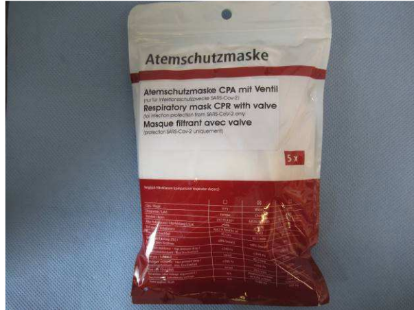
Bild 2 Verpackung der Probekörper