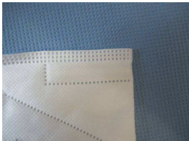
Bild 6 Detail Nasenbügel