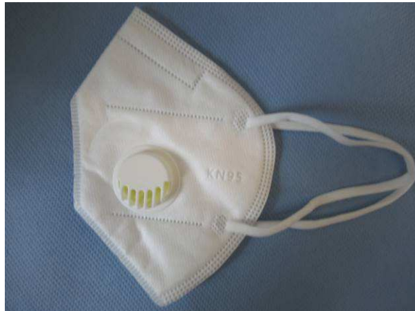
Bild 4 Ansicht des Probekörpers