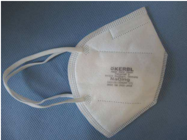
Bild 3 Ansicht des Probekörpers