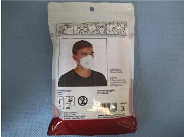
Bild 1 Verpackung der Probekörper